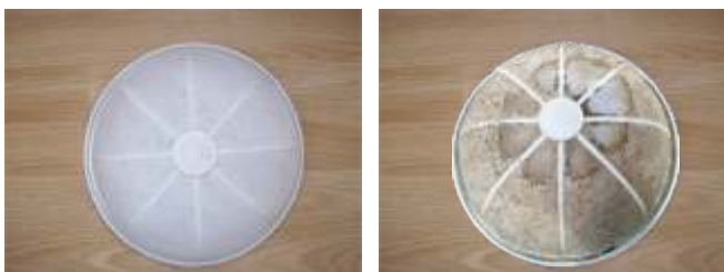
Filtro de microfibras sintéticas rígido para facilitar su cambio y lavado.

El filtro SINCO atrapa ácaros, polen, polvo e insectos